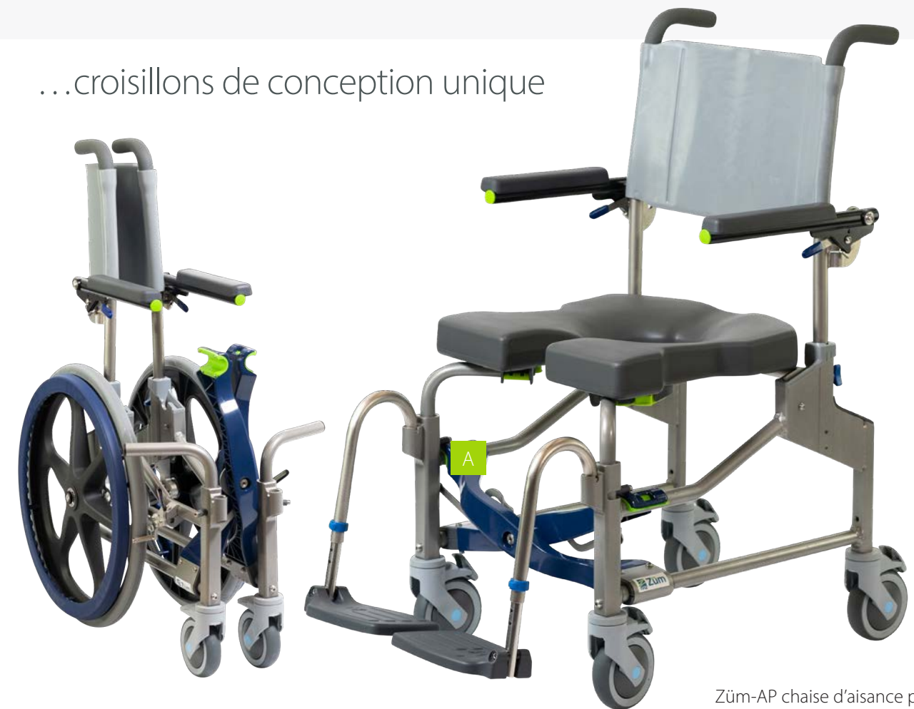
Züm-AP chaise d'aisance pliante