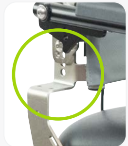
PROFONDEUR AJUSTABLE DU CADRE DU DOSSIER

...pour les enfants en pleine croissance et les adultes de petite taille!