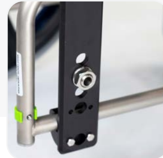
SUPPORTS DE ROUES AJUSTABLES

Les chaises de douche et d'aisance Raz sont conçues et fabriquées selon les normes les plus rigoureuses des professionnels de la santé avertis.