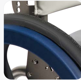
CERCEAUX DE CONDUITE ERGONOMIQUES AVEC REPOSE- POUCE ET ENCOCHES DE DOIGTS